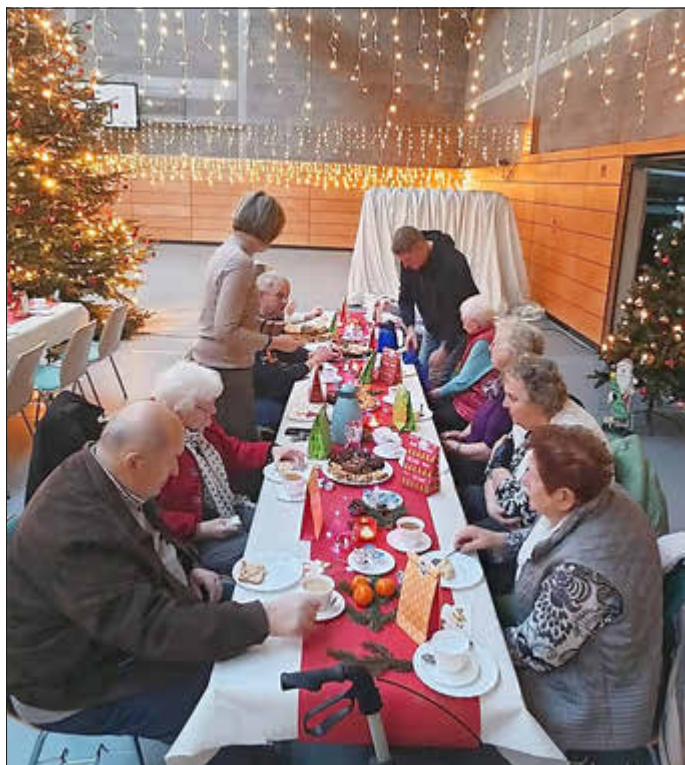
Weihnachtsfeier in der Uwe-Brauns-Halle Negast

Viele Grüße aus dem Feuerwehrhaus, vom Dorfclub und aus dem Friedensgarten.