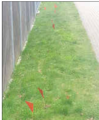
Fähnchen weisen auf hinterlassenen Hundekot hin

Ich weise ausdrücklich darauf hin, dass laut Straßenreinigungssatzung der Gemeinde Niepars die Verunreinigung, hier insbesondere Hundekot, ohne Aufforderung und ohne schuldhaftes Verzögern zu beseitigen ist. Anderenfalls kann die Gemeinde die Verunreinigung auf Kosten des Verursachers beseitigen.