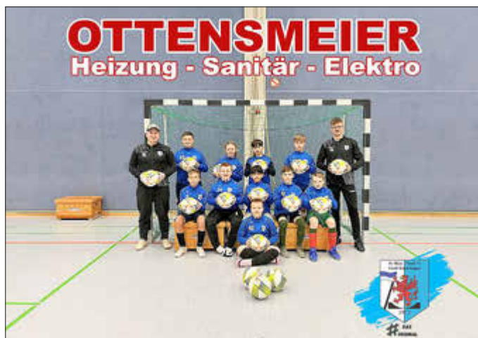
D-Jugend mit neuen Trainingsbällen von der Fa. Ottensmeier