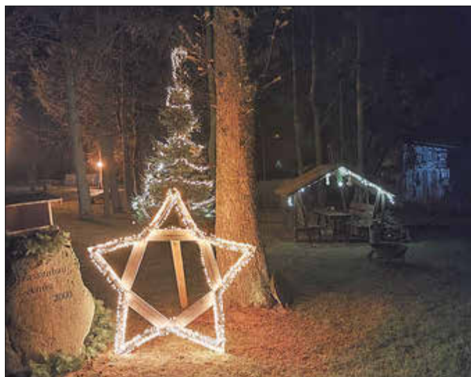
Friedensgarten in Jakobsdorf

Helle Lichter und kreative Kunstwerke beleuchteten den Advent in unseren Dörfern. Im Friedensgarten in Jakobsdorf glänzten Tannenbaum und Stern um die Wette. Am 1. Advent traf sich die Nachbarschaft zum fröhlichen Baumschmücken. Weil viele Leute zusammenkamen, konnten auch das letzte Herbstlaub weggeharkt und der Gehweg gefegt werden. Kaffee und Glühwein waren verdient.