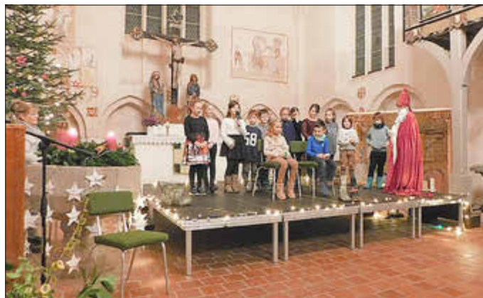
Klasse 2a/b mit ihrem Nikolausstück