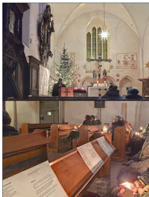
Christvesper in Steinhagen