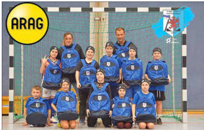
F I -Jugend mit ihren neuen Rucksäcken von ARAG Versicherungen