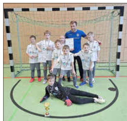
F I-Jugend mit dem zweiten Platz beim Neujahrscup der TSG Zingst

Selbstverständlich ist zu Beginn des neuen Jahres wieder viel Hallenfußball angesagt. Bislang war unsere F I unterwegs beim Neujahrscup der TSG Zingst. Dabei waren sie auch sehr erfolgreich und konnten sich gegen eine Vielzahl von gegnerischen Mannschaften durchsetzen. Am Ende erreichten sie einen bärenstarken zweiten Turnierplatz. Auch unsere Herren waren schon in der Halle fleißig. Am