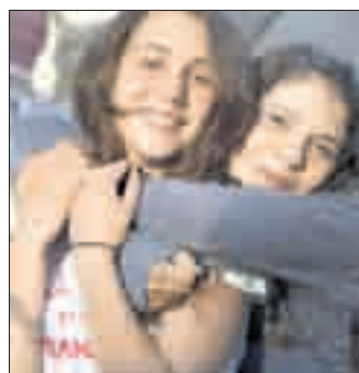
Jahreslosung 2014